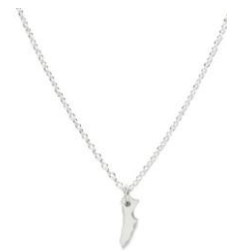
「ニッポンマップネックレス <東京都>」