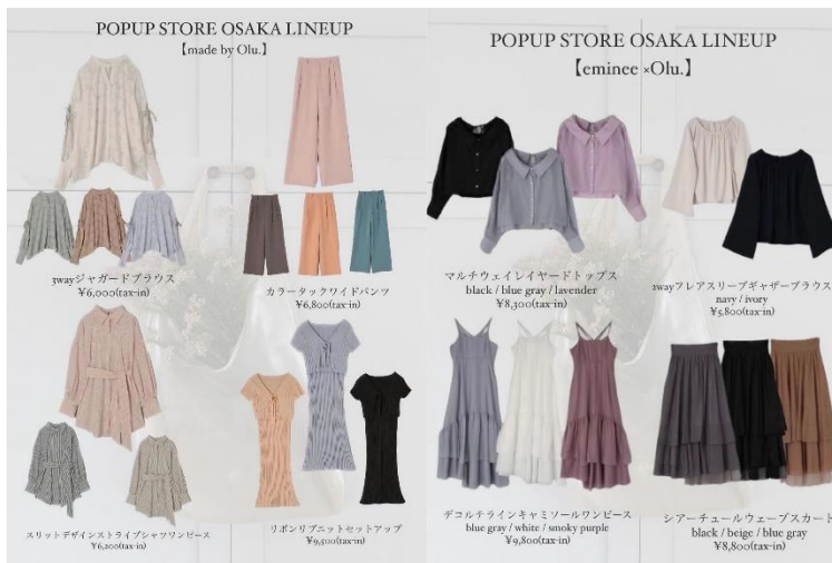
「Olu. POP UP STORE LUCUA OSAKA」販売商品例

また本POP UP STORE実施期間中に、店頭で10,000円(税込)以上お買い上げのお客さまに、今回のためにご用意したオリジナルのオーガンジーバッグをプレゼント。ivoryとOSAKA POPUP限定カラーのpinkの2色のうちからお選びいただけます(数量限定、無くなり次第終了)。