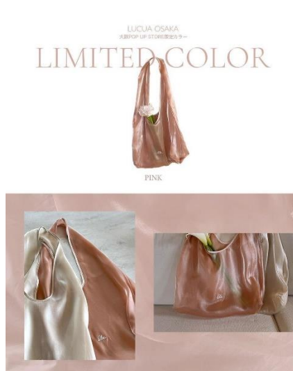
OSAKA POPUP 限定カラー