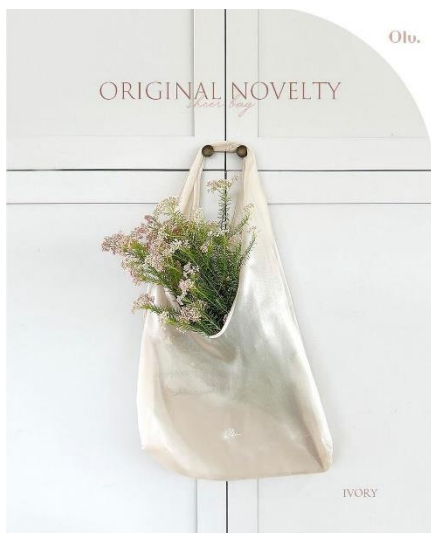
プレゼント対象となるオーガンジーバッグ

また本POP UP STORE実施期間中に、店頭で10,000円(税込)以上お買い上げのお客さまに、今回のためにご用意したオリジナルのオーガンジーバッグをプレゼント。ivoryとOSAKA POPUP限定カラーのpinkの2色のうちからお選びいただけます(数量限定、無くなり次第終了)。