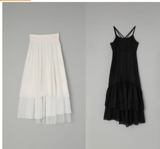
「eminee×Olu.」 ZOZOTOWN 別注カラー