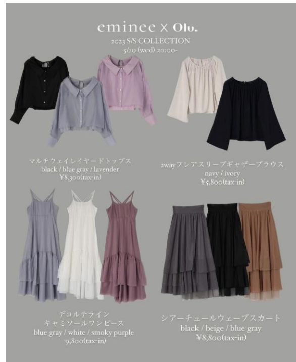
「emineexOlu.」商品ラインナップ