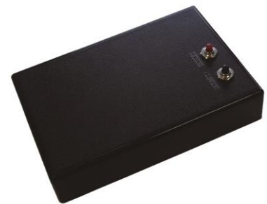
水フィルターモニター(FCM-100) 【特許出願中】

地球上の淡水はわずか0.1%未満にすぎません。人口の増加に伴い、今後深刻な水不足が予想されます。現在も海水の淡水化や下水等の再利用など、様々な技術が世界規模で検討されています。そうした水の活用には濾過フィルターがかかせません。当社ではこうした水問題の解決策の一つとして、当フィルター監視装置が役立つものと確信しております。今後は3年後を目処に海外での販売を行い、売上高5億円を目指しています。