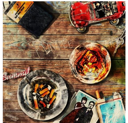
『タイムマシーンにのって/家族の風景』ジャケット

『父と娘の風景』相鉄東急直通記念ムービー https://youtu.be/lseiJCAiF_o