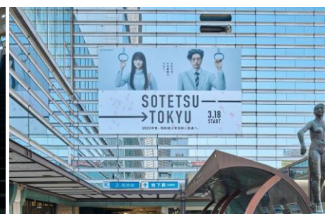
ジョイナス西口ロータリー壁面