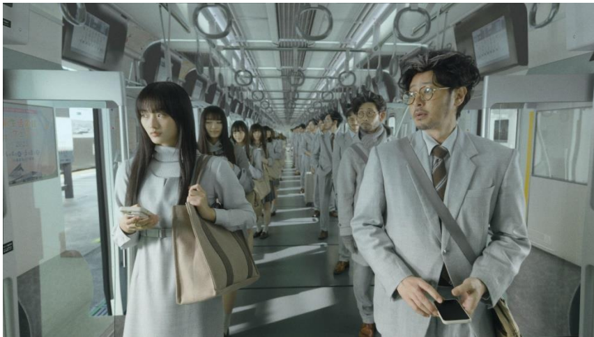
『父と娘の風景』映像内のワンシーン

*1: 公式Youtubeの本編・メイキング、公式Twitterでの総再生数 *2: 動画共有サイト「bilibili」での関連動画総再生数