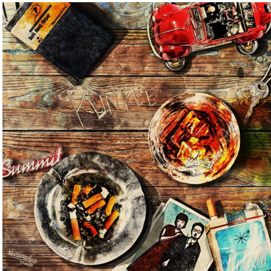
『タイムマシーンによって/家族の風景』ジャケット