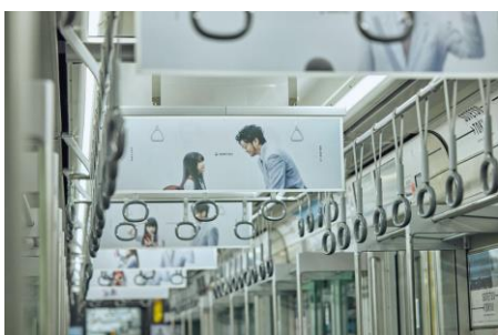
相鉄・東急新横浜線

また、相鉄20000系(主に東急東横線直通用車両)と21000系(主に東急目黒線直通用車両)では、『父と娘の風景』の世界観を再現したトレインジャック広告を展開。さらに、乗り入れ先の一部、相鉄線全駅、JOINUSなどで屋外広告を掲出しています。