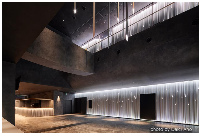
第54回(前回) グランプリ 「東急歌舞伎町タワー-THEATER MILANO-Za パイプアート」

1970年より開催し業界最長を誇るストアフロントコンクールでは、昭和フロントのアルミ建材を使用した施工例の中から優秀な作品を表彰し、発表することで、新たなストアフロントの可能性を示す役割を担ってまいりました。