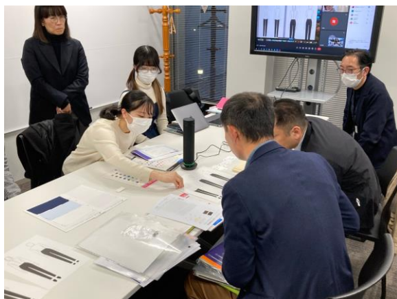
▲学生とフレックスジャパン株式会社との打合せ風景

今回は、コロナ禍を経て服装の自由化が進んだことや、健康維持の観点からスポーツの需要が高まった背景から「スポーツ」と、ORIHIKAの強みである「オフィスカジュアル」を融合させた「スポーツ感覚のオフィスカジュアル」がテーマです。3年目となる本年は、取り組み初となるレディース商品を、昨年よりも多い16名の参加者にデザインいただき、コンテストを実施いたしました。