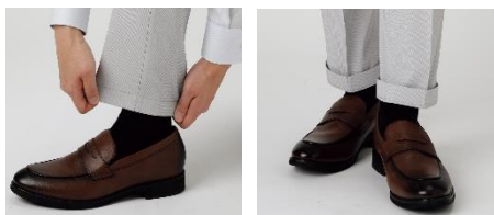
左：内側折り(シングル仕上げ風) 右：外側折り(ダブル仕上げ風)

裾の内側に芯を貼ることで約10cmまで丈調整が可能。補正なしでご購入後すぐにお好みの長さでご着用いただけます。内側折りは「シングル仕上げ」になり、外側折りはカジュアルな「ダブル仕上げ」でお召いただけます。