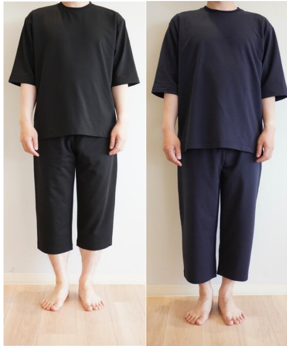
着用カラー：黒 着用サイズ：M(上下)