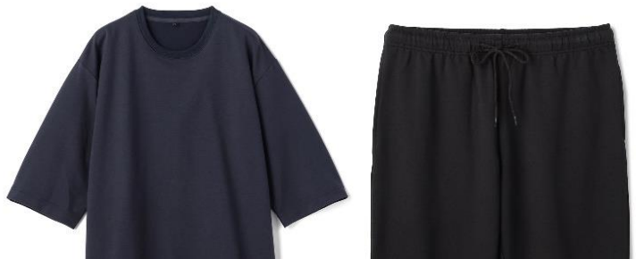
部屋着としてもスリープウェアとしても着用できるデザイン

クルーネックスウェット五分袖シャツと七分丈スウェットパンツをご用意。ベーシックデザイン・カラーのため、年代・性別問わず着用可能です。また、長時間着用することで、より高い疲労回復効果を望めるため、ホームウェアとしてもスリープウェアとしてもお召いただけるデザインにしました。