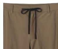
ウエストは紐仕様

商品名:アクティブワークスーツ® 税込価格:5,970円 (ジャケット&パンツ)