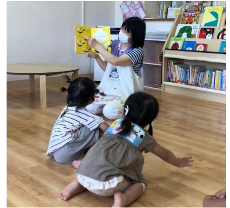
江戸川区の子育てひろば