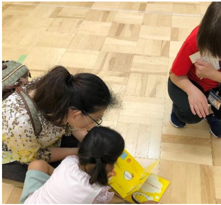
板橋区の高島平児童館