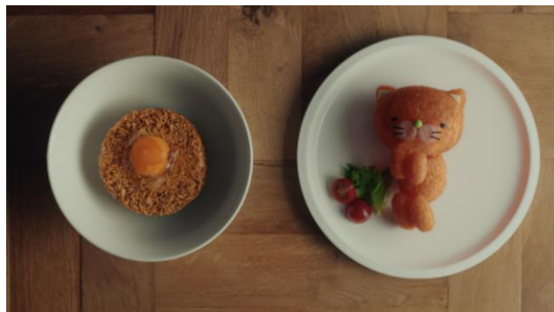
「きよら グルメ仕立て ラーメン篇」

日清食品の「チキンラーメン」は、世界初のインスタントラーメンとして小さなお子さまから大人の方まで幅広い方々にご好評をいただいているロングセラーブランドです。チキンラーメンのおいしさの秘密である『国産チキン』を使用したスープは卵との相性が良く、チキンラーメンに卵をのせるという食べ方は、広く認知されています。一方、アキタの「きよら グルメ仕立て」は、コク、旨み、そして色にまでこだわった、ブランドたまごです。今回、チキンラーメンと卵の相性の良さを再認識していただくとともに、より多くの人に商品ブランドへの親しみを持っていただくことを目的にコラボレーションTVCMを放映いたします。