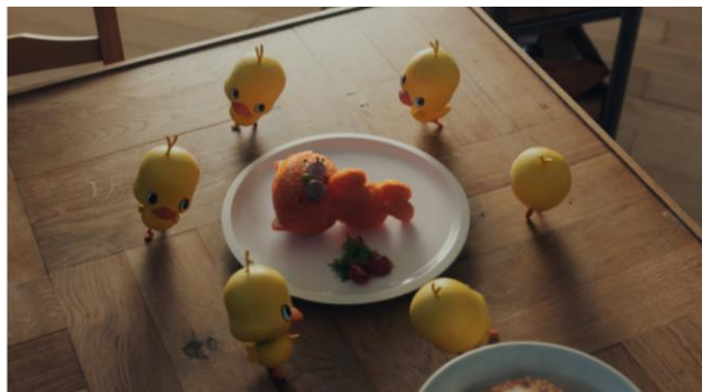
「チキンラーメン たまご篇」

今回のTVCMでは、商品キャラクターであるケチャップライスでできた「寝冷えネコ(きよニャ)」と「ひよこちゃん」が初共演を果たしました。かわいらしいキャラクターのこれまでに見せたことのない表情も注目のポイントとなっています。