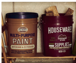
ストレージバケツ ベージュ/ワインレッド 各¥1,798(税込)