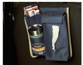
シートバックポケット ネイビー/カーキ 各¥698(税込)