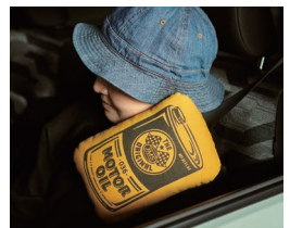
シートベルトクッション オイル缶/ガソリンスタンド 各¥698(税込)