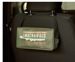
シートバックティッシュケース カーキ/ネイビー 各¥598(税込)