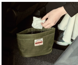
車内用ゴミ箱 カーキ/ネイビー 各¥798(税込)