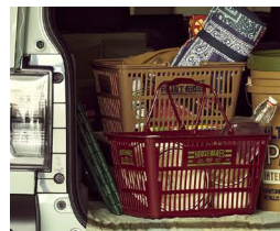
ショッピングバスケット ベージュ/ワインレッド 各¥898(税込)