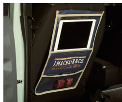
シートバックタプレットケース ネイビー/カーキ 各¥798(税込)