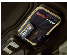
サンバイザーポケット ネイビー/カーキ 各¥598(税込)