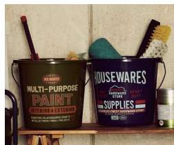
PPバケツ カーキ/ネイビー 各¥898(税込)