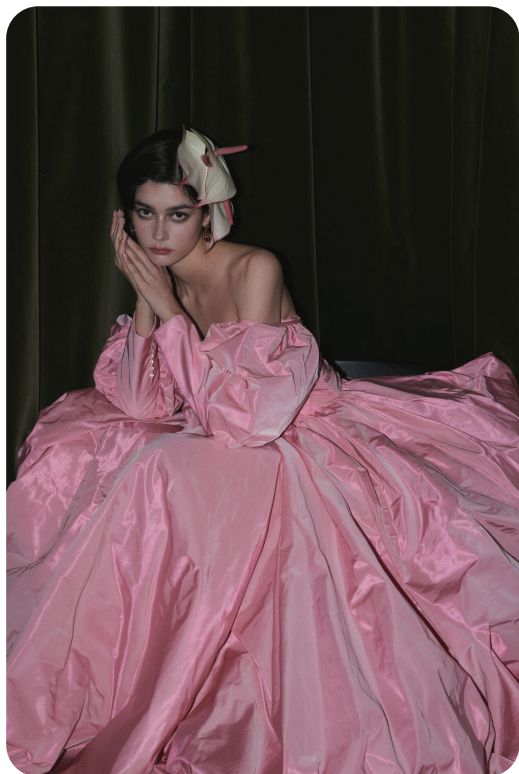
Yolan Cris x SYA のオリジナルドレス

■「Yolan Cris (ヨーランクリス)」 URL : https://www.yolancris.com/