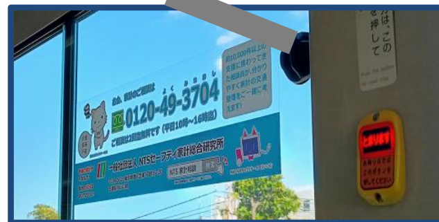
横浜市営バスの一部路線に、広告を掲載しております。