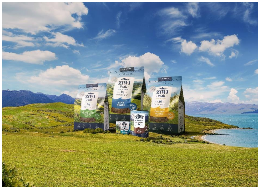
(ZIWI®の商品ラインナップ)

ZIWI®は、総合栄養食として毎日の食事に、または栄養価の高いトッピングやおやつとして、様々な方法でペットに与えることができます。例えばペットの食事のトッピングとして1/4量を置き換えるだけで、ZIWI®に最大96%含まれる牧草飼育の肉類や天然の魚、内臓、骨や緑イ貝などのスーパーフードにより、ペットの食事の栄養価を大幅に高めることができます。