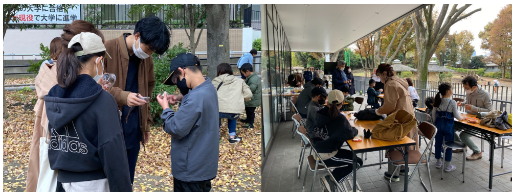
親子で虫探しをしている様子

子どものキャリア支援と新宿区の生物多様性維持を目的に、新宿区にある戸山公園にて、戸山地区ボランティア団体「えんがわ家族」と千葉大学園芸学部園芸学科 応用昆虫学研究室所属の現役大学生(虫博士)、株式会社ネオキャリアの産学民連携にて構成された「インセクトキャリア研究会」が開催した、「虫」を教材とした親子参加型のワークショップです。勤労経験のない子どもたちにも分かりやすいように虫を教材とし、捕まえた虫の働き方や役割から人間の働き方を考えるきっかけをつくるというキャリア支援と、公園の生物多様性の調査を行いました。