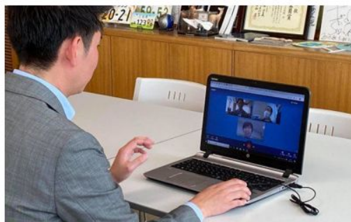
オンライン会議で「Calling for Government」を活用いただいている様子