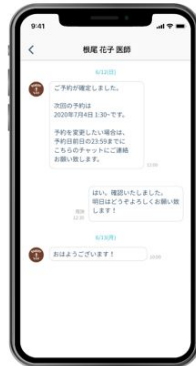
メッセージ詳細画面