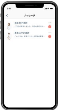
メッセージ一覧画面

チャット上で医師と直接やりとりできるため、オンライン診療前や診療後に手軽にご相談が可能です。