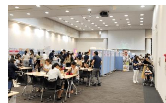
イベントの様子 2018年実施時

大変恐れ入りますが、ご取材いただく場合は7月25日（木）12時までに、2枚目のFAX返信用紙に必要事項を記入の上ご返送いただくか、ネオキャリア 広報（ koho@neo-career.co.jp ）までご連絡いただきますよう、お願い申し上げます。