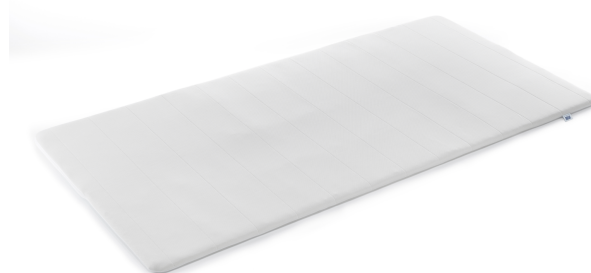
オリジナル マットレスパッド (シングル)

・6か月プラン: 11,400円 (2018年11月12日(月)~2019年5月11日(土))