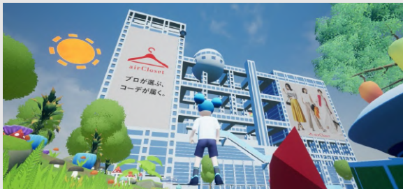
バーチャルフジテレビ社屋の巨大ラッピング広告

フジテレビの夏イベント「バーチャル冒険アイランド」内でもコラボレーション企画実施！