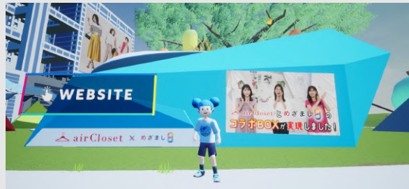
「めざまし8」とのコラボブース