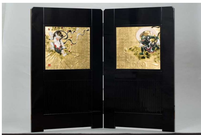
【屏風 依屋宗達画「風神雷神」フレーム：本漆】

繊細で迫力ある日本画が、透明感のあるガラスで表現される見ごたえのある作品から、黒木氏の魅力を存分に感じていただける展覧会となります。