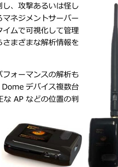
WifiWall Dome 本体 (Wi-Fi 通信検知解析コンピューター)

新たな攻撃の発生にともなって検知する対象が拡大され、ファームウェアのアップデートで常に更新されていきます。提供を開始する 4 月 1 日時点では以下の通り。