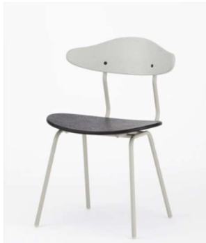
Gray x Rubber Black x Gray White Steel Frame