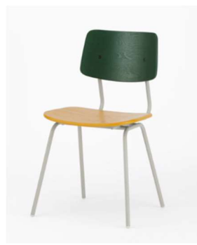
Green x Mustard Yellow x Gray White Steel Frame