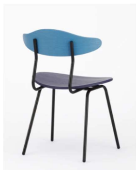
Blue x Violet x Black Steel Frame