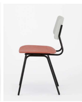
Gray x Pink x Black Steel Frame