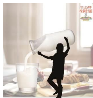
※上記写真はイメージです。