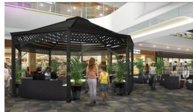
※上記パースはイメージです。

お子さまからご年配の方、またファミリーでご来店されるお客様に、館内を快適にお買物していただけるよう、レストスペース、館内ソファの充実を図ります。