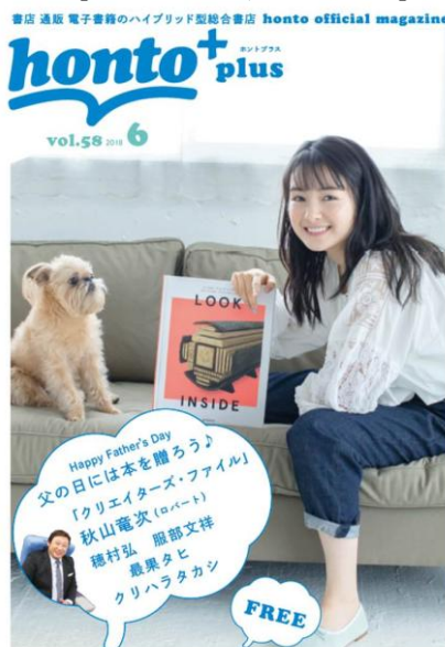
カバーモデル：葵わかな