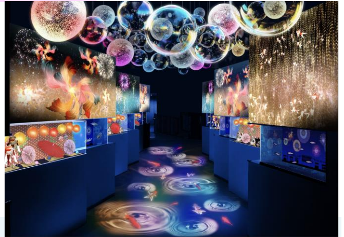
「祭り花火 展示/写真左から：バナナフィッシュ、ミナミトビハゼ、サザナミフグ ※イメージ」

小水槽と交互に並んだショーケースはお祭りの定番アイテム、お面や風車などを飾りました。露店をのぞき込むような感覚で生きものたちの様子をご見学いただけます。