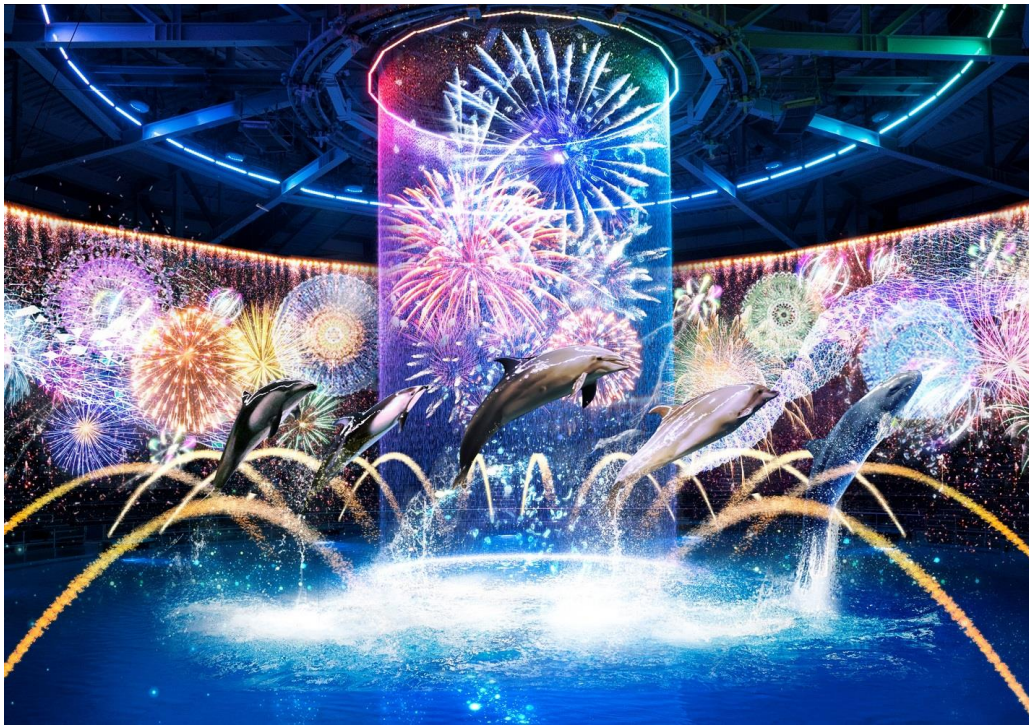
「瑠璃花火 ※イメージ」