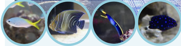
「海空花火/写真右：ショータイム 展示/写真左から：ユメウメイロ、サザナミヤッコ、ハナヒゲウツボ、ジュエルダムセル ※イメージ」