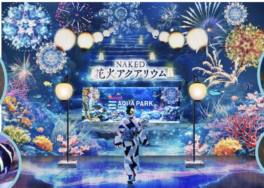
「ウミノ参道 展示/写真左上:スミレナガハナダイ、左下:フレンチエンゼル 右上:ナンヨウハギ、右下:フレイムエンゼル ※イメージ」

ゲストのアクションによって、花火が打ちあがるインタラクティブな仕掛けも取り入れながら空間丸ごと演出し、入口から美しい世界観へと引き込みます。