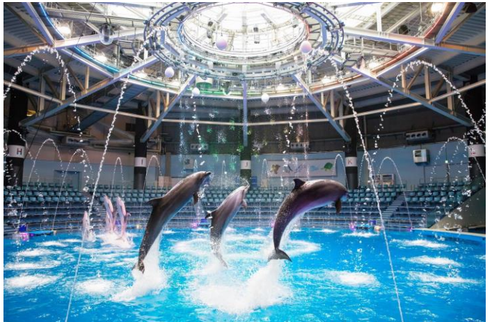
「WELCOME TO RYUGU FESTIVAL ※イメージ」

個性的なメロディーとテンポに合わせて、イルカたちが水中ダンスやダイナミックなジャンプを披露。さらに、その場でできる簡単な振り付けで会場一体となって盛りあがる“ゲスト参加型”の演出や豪快な水しぶきを堪能できる“スプラッシュ”も取り入れます。“RYUGU”の世界観をめぐる、同イベントのメインコンテンツとして愉快なひと時をお届けします。