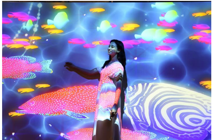
「ユカタハタ ※イメージ」