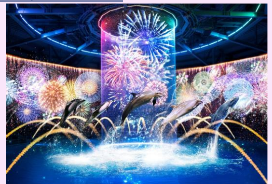
「瑠璃花火 ※イメージ」