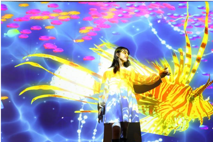
「ハナミノカサゴ ※イメージ」

パターンは全部で5種類。「ハナミノカサゴ」や「ユカタハタ」など、選りすぐりのファッションブルな魚たちを集めました。