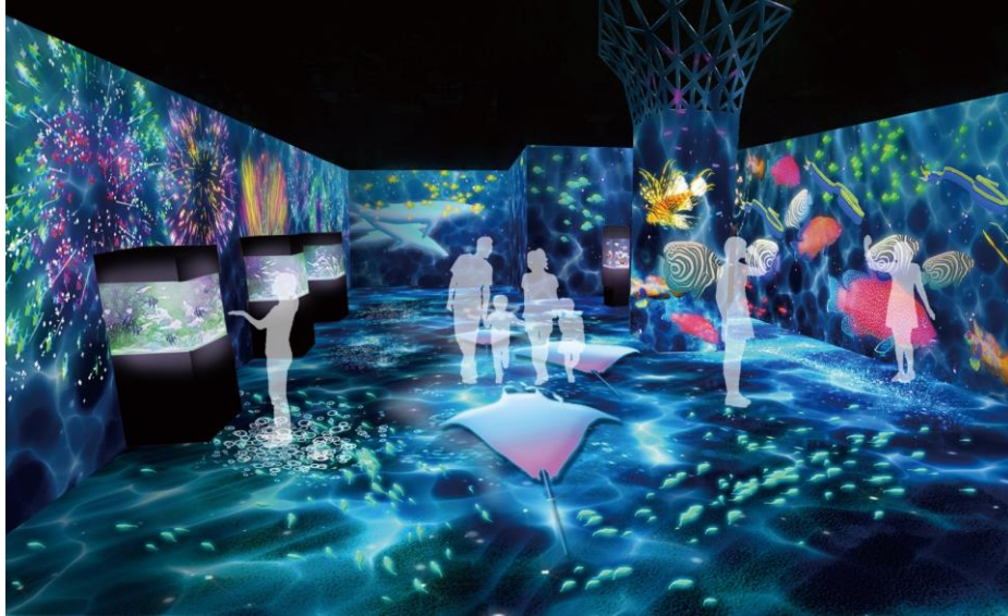
「UO FESTIVAL ※イメージ」

22台のプロジェクターを使用したダイナミックな映像演出とレイアウト変更可能な水槽の調和で、圧倒的な世界観への没入体験を提供するイマーシブエリア「パターンズ」。今回は、魚たちが繰り広げる“海の世界のお祭り”をテーマに、賑やかで彩りあふれる空間を創出します。海中のシーンを描いた空間には、映像の水面が静かにゆらめき、カラフルな魚たちのシルエットが行き交います。さらに、1フロアで全く異なる2つの体感コンテンツをご用意しており、向かって左壁面には群れを成す魚たちの展示と映像がリンクして“花火”が打ちあがる「UO HANABI -魚花火-」を、右壁面では展示生物の模様やカラーを投影し、ゲストが身にまとうことができる「UO YUKATA -魚浴衣-」をお楽しみいただけます。また、数分間に一度、大輪のUO HANABIが空間を飾るショータイムも開催し、お祭りを盛りあげます。