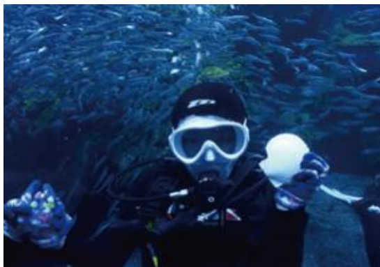
ホタテを持って記念撮影