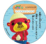
ラコスケのステッカー