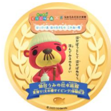
ラコスケのステッカー

場 所： 大水槽 いのちきらめく うみ 時 間： ① 12:00 ~ 14:30 ② 14:30 ~ 17:00 参 加 費： 9,000円 ※水族館入館料は含まれておりません。 参加人数： 各回4名さま 参加資格： 18才以上、心身ともに健康な方 (詳しくは公式HPをご確認ください)