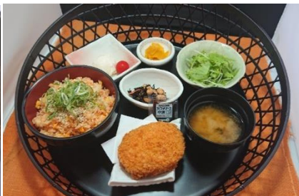
「秋御膳」 料金：1,600円 場所：哉介