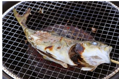
ワカシ 塩焼き（バーベキュー）