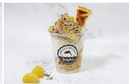
「モンブランサンデー」 料金：550円 場所：ドルフィン