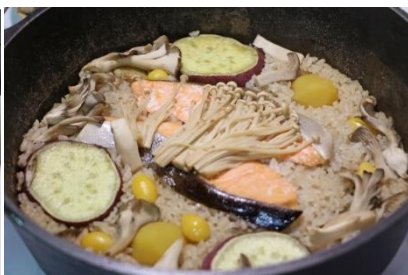
「ダッチオーブンで作る秋まるごとごはん」 料金：1,990円 場所：Seafood & Grill YAKIYA