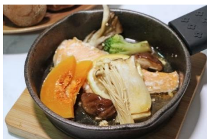
「サーモンとキノコのバター焼き」 料金：890円 場所：Seafood & Grill YAKIYA

島内のレストランや軽飲食店舗では、食欲の秋にぴったりなメニューをご用意いたします。手ぶらでBBQが楽しめる「Seafood & Grill YAKIYA」では、秋の味覚であるサーモンやさまざまなキノコが入ったバター焼き、炊き込みごはんを秋を存分にご体感いただけます。モンブランをふんだんに使用したパンケーキのほか、今夏リニューアルオープンした軽飲食店舗「ドルフィン」では、モンブラン味のふわふわワッフル、そして横浜市にある牧場“小野ファーム”のソフトクリームを使用したサンデーなど、甘いスイーツも新たに期間限定で登場いたします。