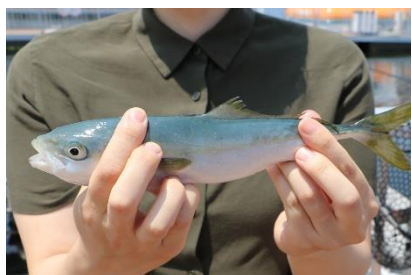
ブリの幼魚「ワカシ」