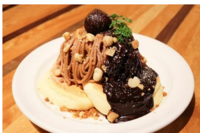
「モンブランパンケーキ」 料金：1,650円 場所：メレンゲ