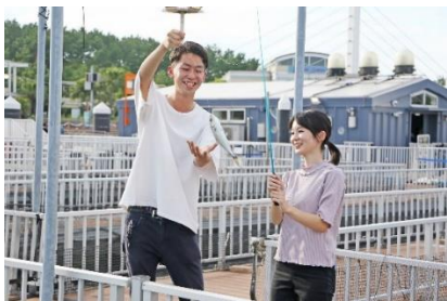
フィッシャーメンズオアシス（魚釣り）

通常釣れる魚はアジとマダイですが、今秋はブリの幼魚「ワカシ」を期間限定で釣ることができます。「うみファームキッチン」でフライやグリル、バーベキューレストラン「Seafood & Grill YAKIYA」で塩焼きにして食べることができます。普段とは一味違った魚釣りをお楽しみください。