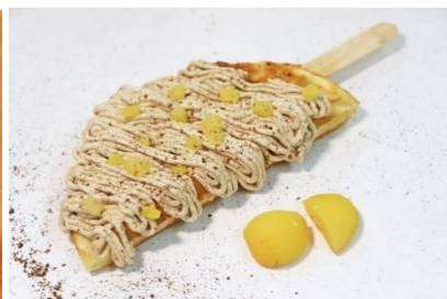
「モンブランワッフル」 料金：450円 場所：ドルフィン