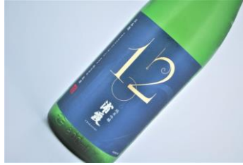
浦霞 純米吟醸 No. 12