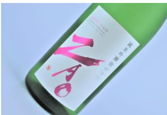
ZA0 純米吟醸吟のいろは