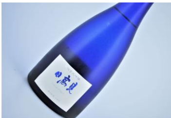
★日高見 中取り大吟醸吉川産山田錦 (48杯限定)