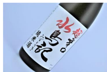
水鳥記 純米超辛口