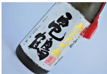
★亀鶴（きかく）純米大吟醸