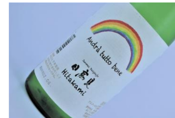
日高見 純米大吟醸虹の応援ラベル