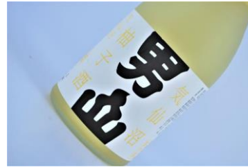
気仙沼男山ゆず酒