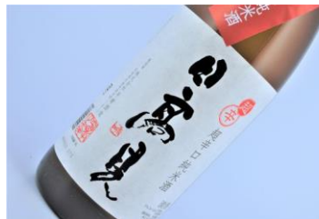
日高見 超辛口純米酒