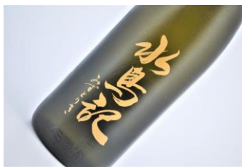
水鳥記 特別純米山田錦