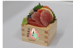
升盛お刺身（オリジナル升付き）