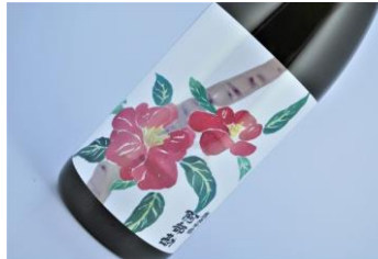
阿部勘 純米吟醸さざんか