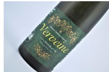
蔵王 レモンバーベナハーブ酒