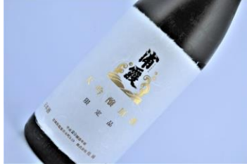
★浦霞 大吟醸原酒 20BY 古酒 (60 杯限定)