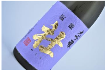
★社 (やしろ) 大吟醸