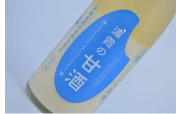
浦霞の甘酒 (ノンアルコール)