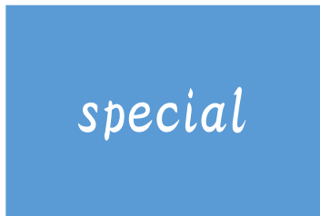
★ZA0 純米大吟醸斗瓶取り (非売品)