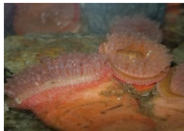
イワホリイソギンチャク