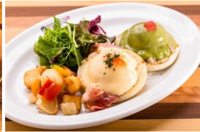
エッグベネディクト

期 間 : 2019年7月25日(木) グランドオープン 時 間 : 11:00~20:15 ※ラストオーダーの時間です。花火開催日は異なります。 場 所 : ベイマーケットA棟1階(パラダイスキッチン跡地)