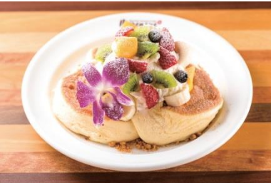
ハワイアンフルーツパンケーキ