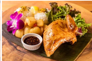
ハワイアンバーベキュー チキンプレート