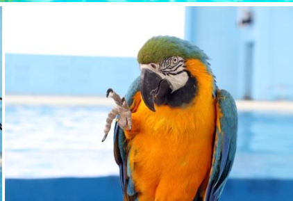
ルリコンゴウインコ