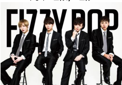
F I Z Z Y P O P (ナチュラル炭酸)