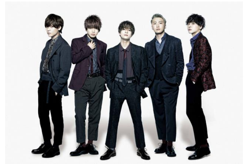
D a - i C E

昨年に引き続き、公式アンバサダーには5人組のダンス&ボーカルユニットの「D a - i C E」が就任しました。ウォーターランフェスティバル公式ホームページではメッセージ動画を公開中で、イベント当日にはライブを披露しウォーターランフェスティバルを大いに盛りあげます。また、5人組男性ダンスボーカルグループ「F l o w B a c k」、男女混合5人組パフォーマンスグループ「I o l - e l o - e l e r」などスペシャルゲストがL I V E & D Jゾーンに登場いたします。