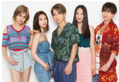
I o l - e l o - e l e r