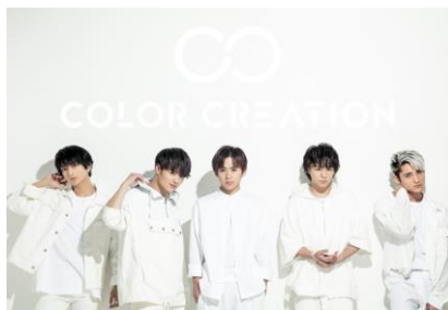
C O L O R C R E A T I O N