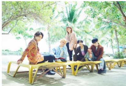
F l o w B a c k