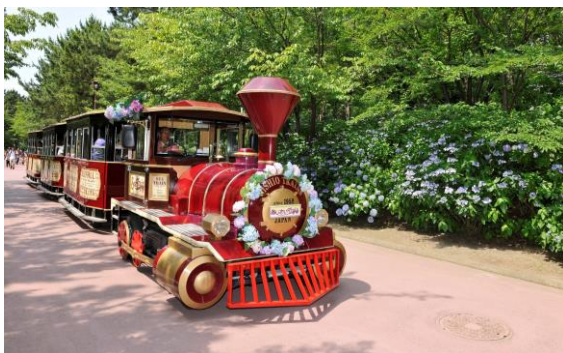
あじさいトレイン

『横浜・八景島シーパラダイス』の人気アトラクション「シートレイン」と「シーパラダイスタワー」があじさい仕様になってお客さまをお迎えいたします。普段はアクアミュージアム⇄メリーゴーラウンド間で運行している「シートレイン」が、「あじさい祭」期間中はコースを変え、「あじさいトレイン」として登場いたします。また、「シーパラダイスタワー」ではお客さまに双眼鏡や花冠を無料でお貸出しし、上空からのあじさい島の風景を、気分を変えてご堪能いただくことができます。雨天時でも快適に利用できるので、島内を巡ったあとはのんびりアトラクションからあじさいを満喫してはいかがでしょうか？