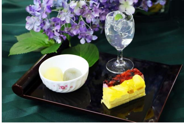
商品名：あじさいデザートセット 場 所：パラダイスキッチン 料 金：650円 ※スタンプラリー終了者580円