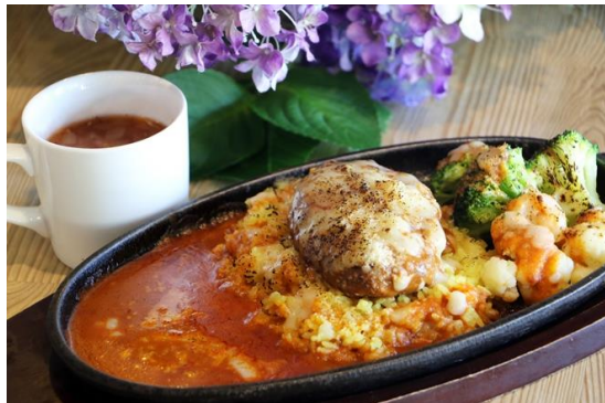
商品名：ハンバーグ焼きカレー 場 所：CLASSIC 料 金：1,680円