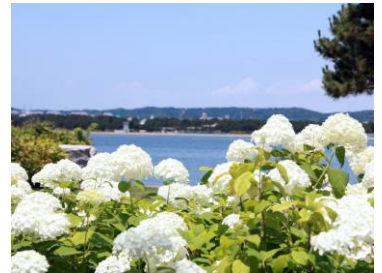
シーサイドガーデン

シーパラシー太くん！お誕生日おめでとう！ゴールには八景島で見られない新種のあじさいと、大階段には素敵な撮影スポットが。