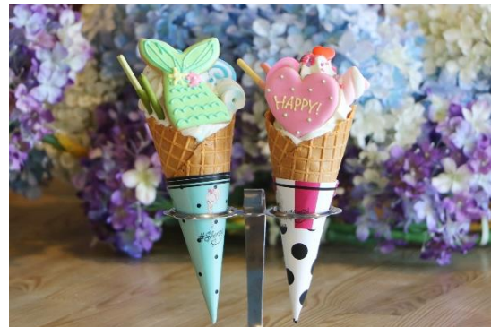
商品名：ハンドパフェ ブルー／ピンク 場 所：CLASSIC 料 金：980円