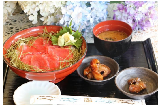
商品名：紫陽花盛り御膳 場 所：シーストーリー 料 金：1,480円

期 間：6月9日(土)～7月1日(日) 場 所：ベイマーケット各店舗 ※一部不参加店舗がございます。