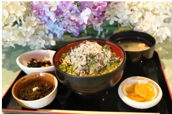
商品名：あじさい食事セット 場 所：哉介 料 金：1,200円