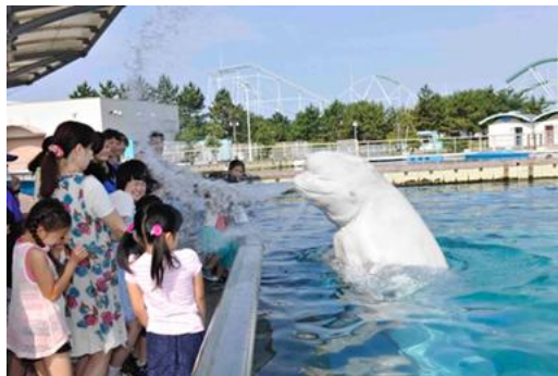
シロイルカの水吹き