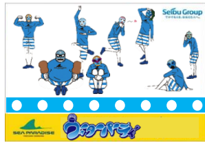
シーパランオリジナルステッカー

期間中、『水』に関わる施設やアトラクションにスタンプ台を設置いたします。 『水』に関わる施設を網羅したこのスタンプラリーで、シーパラダイスの“涼”を余すことなく感じよう！また、すべてのスタンプ合計8個を集めたお客さまには、「シーパランオリジナルステッカー」をプレゼントいたします。スタンプラリー参加者には水鉄砲35%OFF（臨時ショップ、ジンベエSHOP、フレンジアにて販売）や、「海のバーベキュー 焼屋」での生ビール100円OFFなど、お子さまだけでなく大人の方にとっても嬉しい特典付きです。是非参加してみよう！