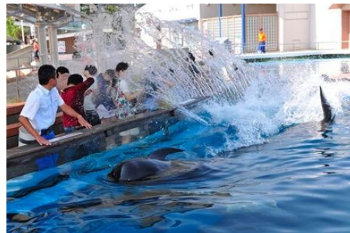
尾びれを使ったスフラッシュ