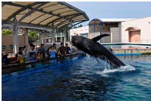
クジラの豪快なジャンプ