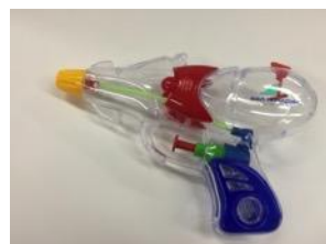
シーパラオリジナル水鉄砲

いたるところで水かけイベントが発生するこの時期、 シーパランとたたかう道具は必須。 ウォーターパーティの期間中、ワンデーパスをお買い求めいた だいた方にもれなく「オリジナル水鉄砲」をプレゼント いたします。また、大きい水鉄砲の販売（1,100円～） も行います。 さあ、シーパランとたたかう準備はできたか！？