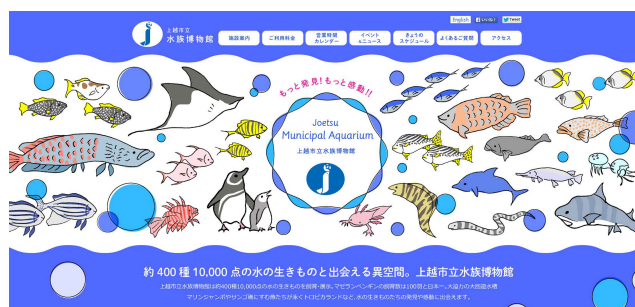
4月1日よりリニューアルする公式ホームページ

さらに、お子さまから大人まで誰もが楽しく学べるように、公式HPと館内パンフレットの刷新や、魚名板・誘導サインなども順次リニューアルしていきます。新しい「上越市立水族博物館」にご期待ください。