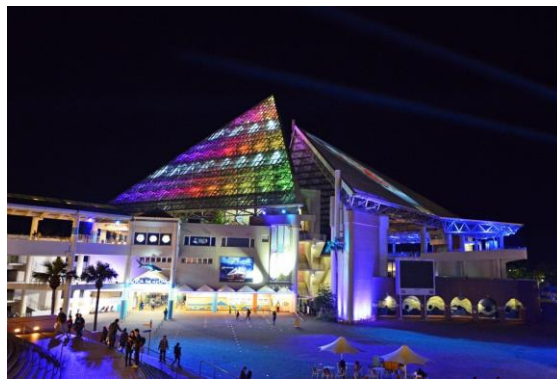
アクアミュージアム前広場から

軽快なEDM (Electric Dance Music) に乗せて、巨大な大屋根のスクリーンに映し出されるアーティスティックなプロジェクション映像とビームライトをはじめとした光の演出が、夜桜の新たな概念を創出していきます。さまざまな場所から「スカイ ライト マジック」をお楽しみください。