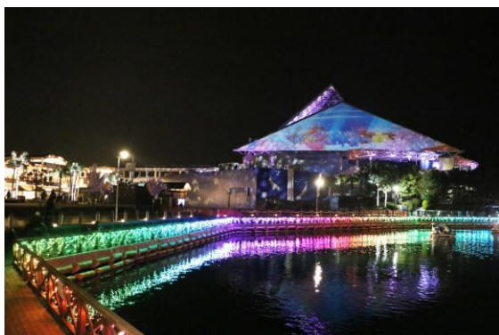
ボードウォークから