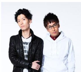
エグスプロージョン

また早朝には、房総半島の山並みから美しい「初日の出」が昇り、新年の眺望が満喫できます。