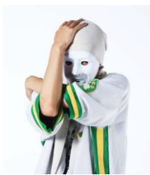
ひとりできるもん