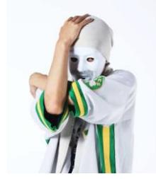
ひとりできるもん