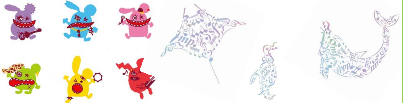
【リトグリキャラクター（メンバーカラー6色のモンスター）】

“リトグリキャラクターのモンスター”や“音符が集まって海の生きものたちの形になる”映像やアートワークなどの装飾（画像参照）と楽曲使用によって、館内にもリトグリのカラフルポップな世界が広がります。また、リトグリプロデュースの水槽も登場し、メンバーカラー6色の海の生きものたちを展示いたします。