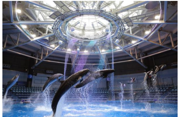
デイパフォーマンス（イメージ）

時間：11:30 / 13:00 / 14:30 / 16:00 （約15分間）