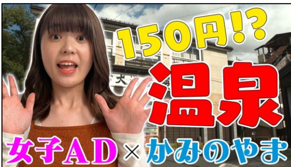
◎ #01 【女子AD】 まだ誰も知らないおんせんまち “かみのやま”弾丸わくわく旅【体当たり】