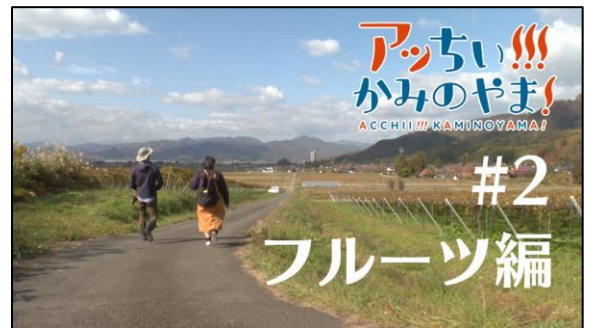
◎ #02 【女子AD】 超絶！絶品フルーツ満喫&美味すぎるワインの旅【フルーツ天国】