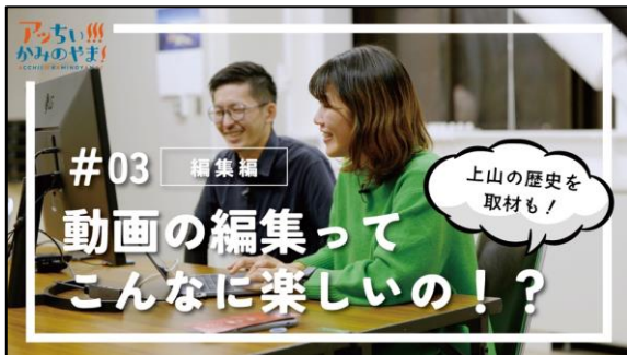
◎#03 動画の編集ってこんなに楽しいの!?