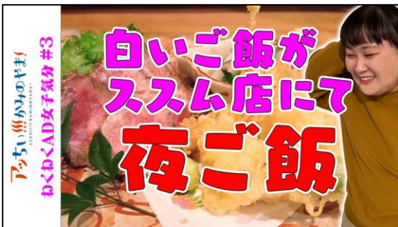
◎ #03 【女子AD】 白いご飯がススム店にて夜ご飯【体当たり】