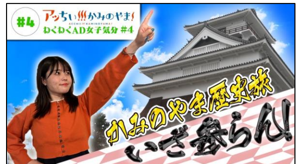
◎ #04 【女子AD】 かみのやま歴史旅 いざ参らん！【まち歩き】