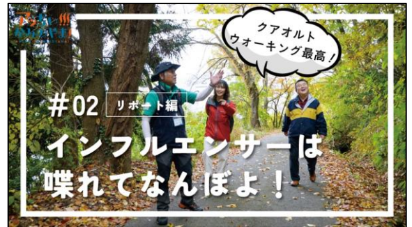
◎#02 インフルエンサーは喋れてなんぼよ!