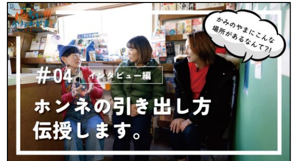
◎#04 ホンネの引き出し方伝授します。