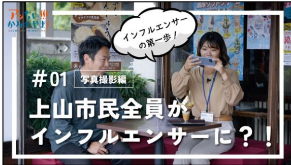
#01 市民全員がインフルエンサーに?! ～映える写真ってどう撮るの～