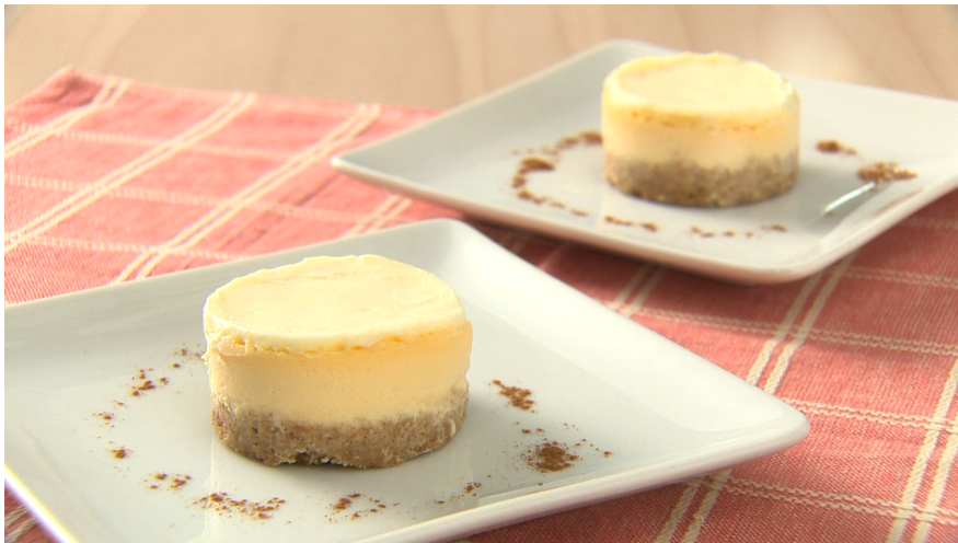
「Nakazawa 三姉妹のチーズケーキ」

「Nakazawa 三姉妹のチーズケーキ」は、中沢フーズの「リコッタ」、「生クリーム」、「サワークリーム」を使用。それぞれの商品の持ち味と魅力を活かし、優しい食感、まろやかな酸味とコク、カロリー控えめなチーズケーキに仕上げました。