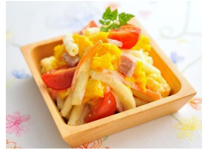
トマトとスクランブルエッグのマカロニサラダ

ジューシーな口あたりのマカロニサラダにボロニアソーセージをあわせました。ソーセージのコクと旨味がソースと一体となって口全体に広がります。パスタサラダ専用ソースを使用していますので、時間が経ってもぷりぷりとしたマカロニの食感をお楽しみいただけます。