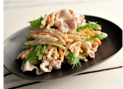
豚しゃぶの金ごまごぼうサラダ

ごぼうサラダを世の中に送り込んだ当社が自信を持ってお届けするサラダです。ごまの王様「金ごま」を黄金バランスで合わせ、風味豊かな味わいに仕上げました。シャキシャキとしたごぼうの食感と金ごまの贅沢な味わいをご堪能ください。