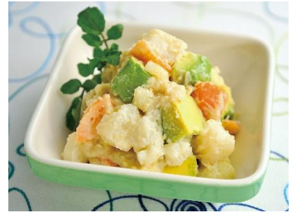
アボカドポテトサラダ

北海道で生育されたサラダに適したじゃがいも「さやか」を使用したポテトサラダです。さやかのおいしさを大切にするため、泥付きの状態から加工し、いもの風味豊かな味わいに仕上げました。ほくほく・なめらかな食感が特長です。