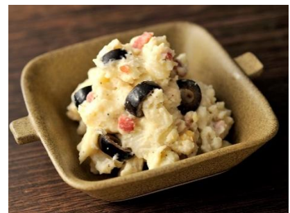
濃厚おつまみポテトサラダ

濃厚なたまご、香り豊かなガーリック、ピリッと辛いペッパーをきかせた絶妙な旨さのポテトサラダです。濃いめの味付けでお酒と共にお召し上がりいただきたい一品です。じゃがいもはサラダのためにうまれた北海道産「さやか」を使用しています。