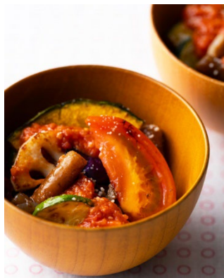
～ひろがるサラダ料理～

しっとりした厚焼き卵に、シャキッとした新鮮な野菜やフィリングを挟んだまるでサンドイッチのような斬新な厚焼き卵のサンドです。厚焼き卵の色合いが華やかさを演出します。