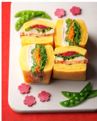
～つなぐサラダ料理～