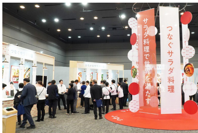
メインの「サラダ料理」コーナーの様子

原材料価格や人件費の高騰、人手不足、物流の2024年問題、SDGsへの関心の高まりなど、食品メーカーを取り巻く環境は日々大きく変化しています。その中で当社は、「サラダ料理で世界になる」をビジョンとして掲げ、新たな市場を演出することに注力しながら、新しい価値の創造に挑戦しています。