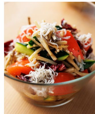
～むすぶサラダ料理～

「味噌汁」を冷製のサラダ仕立てに。焼いたトマト、ズッキーニ、れんこん、かぼちゃなどを丸ごぼうの甘辛煮と和え、トマトベースの味噌ソースをかけて食べるメニューです。