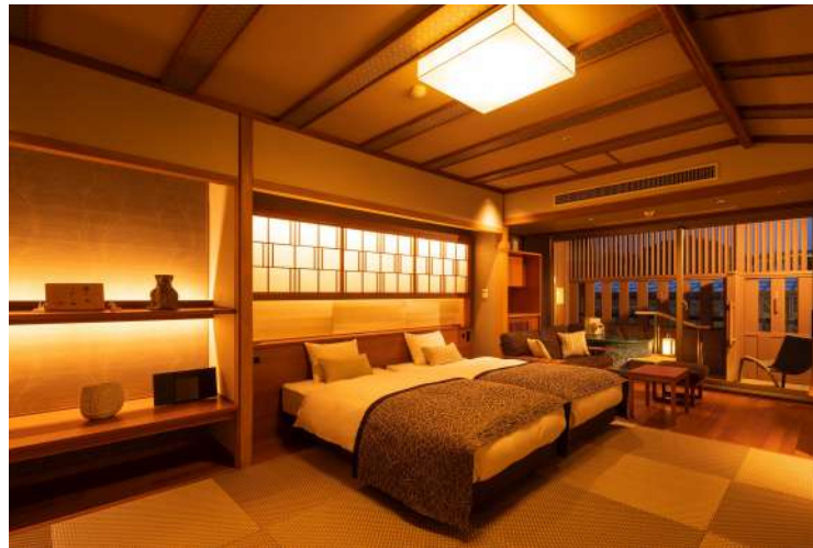
白雲の館<温泉露天プレミアム> ベッド付和室 (定員5名)