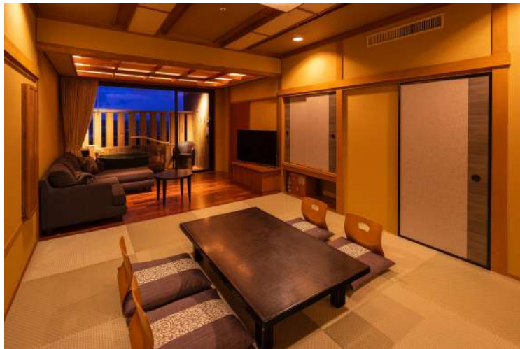
白雲の館<温泉露天プレミアム> セミスイート (定員6名)

白雲の館 標準客室を、現代版湯治文化を安心して体感できるよう、自家源泉を用いた温泉露天風呂付き客室に改修。新たに白雲の館<温泉露天プレミアム>として、3タイプの部屋をリニューアルオープンしました。