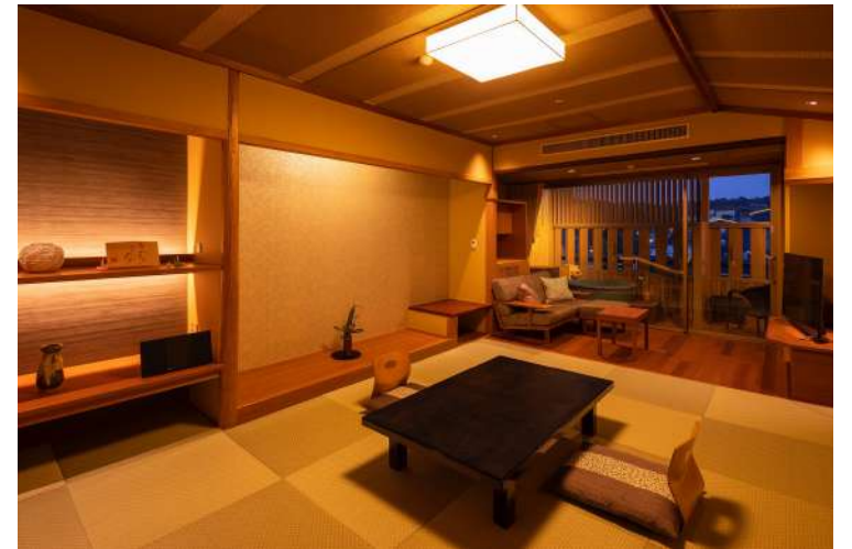
白雲の館<温泉露天プレミアム> 和室 (定員6名)