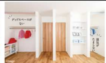
建具を無くす収納計画

リビングの天井高は2.7m。掃出サッシは高さ2.2mを確保しました。明るい陽光をしっかりと採り込み、開放感を演出します。 ※一部天井が下がる場合がございます。