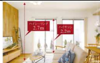
ハイシーリング&ハイサッシ

また、建具を無くすことで家事動線をスムーズにしました。ロールスクリーンでアレンジできるので、建具交換の費用を抑えられます。