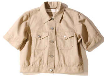
ショートスリーブクロップド ユーティリティージャケット ¥8,990