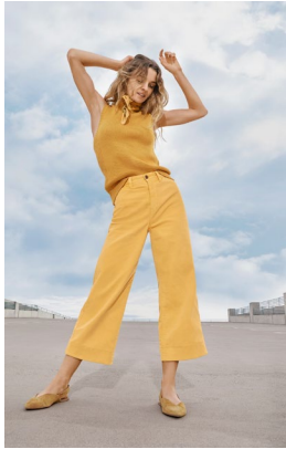
<Women's> ハイライズワイドレッグクロップ ドチノ ¥7,990