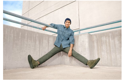
<Men's> ヴィンテージウオッシュスリムフィットチノ ¥7,990