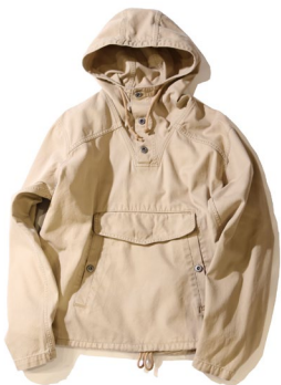
ユニセックスポップオーバー ¥18,900