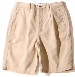
プリーテッドフロントショーツ ¥8,990