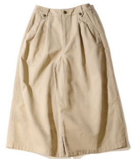
プリーテッドキュロット ¥8,990