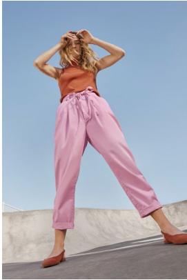
<Women's> ペーパーバックカーキ (一部店舗限定) ¥7,990