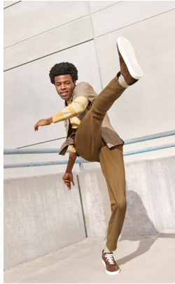
<Men's> Gapflex モダンスリムフィットチノ ¥7,990