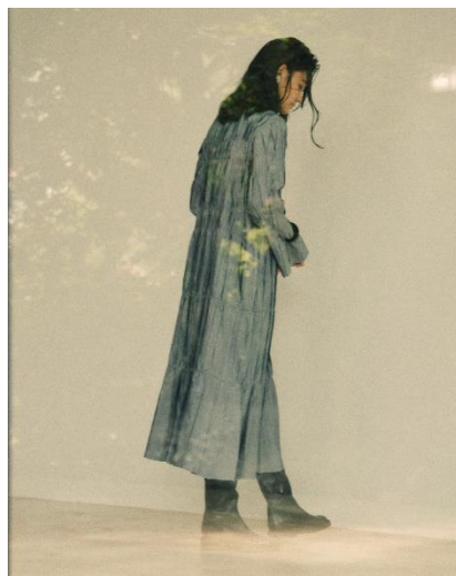
RANDOM PLEATS DRESS / ¥22,000 (TAX IN)