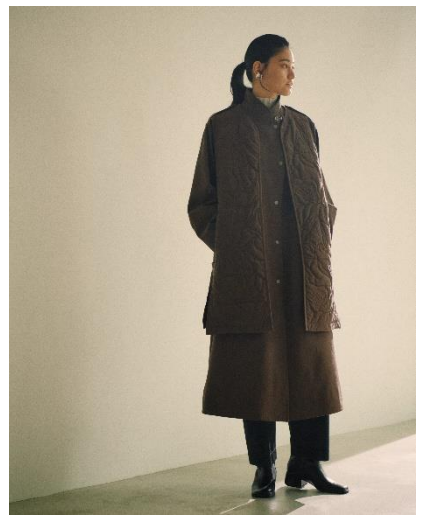
QUILTING COAT / ¥49,500 (TAX IN)