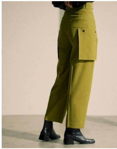
CARGO SLACKS PANTS / ¥15,400 (TAX IN)