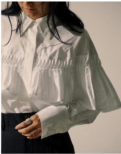
BIG FRILL BLOUSE / ¥16,500 (TAX IN)