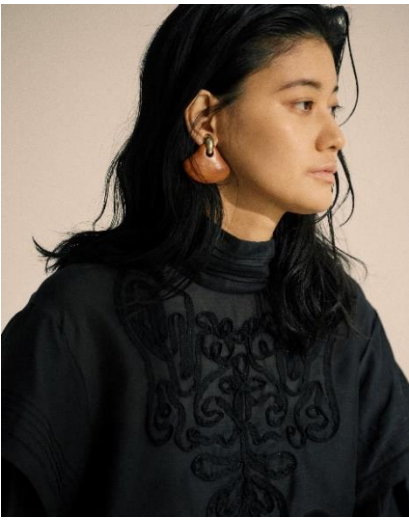
TAPE EMBROIDERY BLOUSE / ¥17,600 (TAX IN)