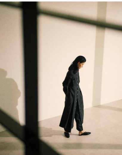
DOCKING ONE-PIECE / ¥17,600 (TAX IN)